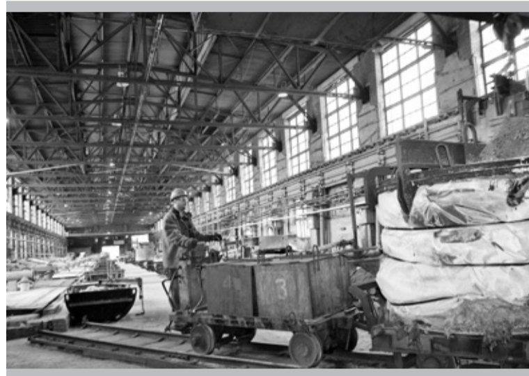
«Поезд» в сырьевое отделение

планируется. А вот завтра, тринадцатого, будем пускать в работу новый пятьдесят пятый электролизёр на третьей серии. А послезавтра — останов двадцать шестого. Тоже очень интересный процесс. У нас в электролизе вообще много интересного!».