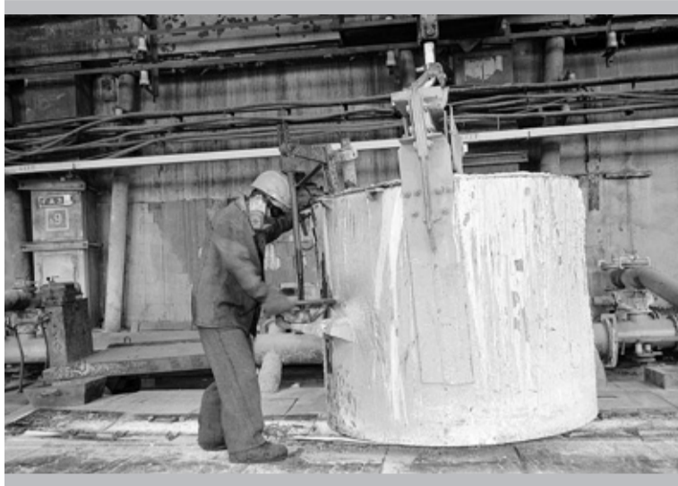
Идёт заливка третьей серии

Следую дальше. Одна из первых на пути с третьей се-