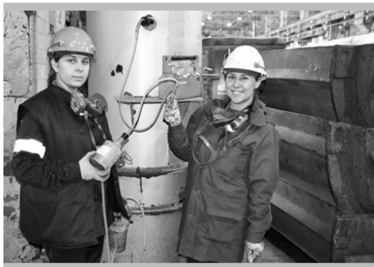
Замеры отходящих газов от электролизёров